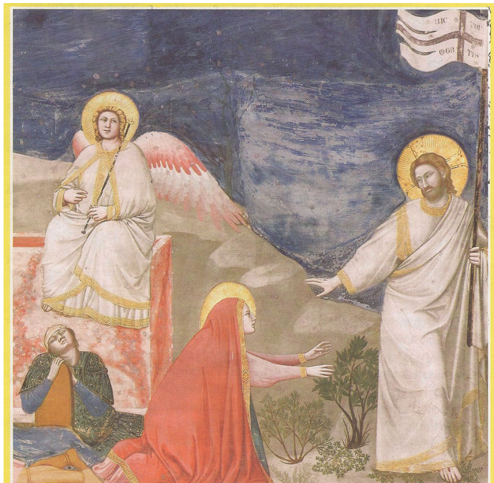
Giotto di Bondone, Auferstehung Christi; Padua, Capella degli Scrovegni; Foto: © Alinari-Artothek